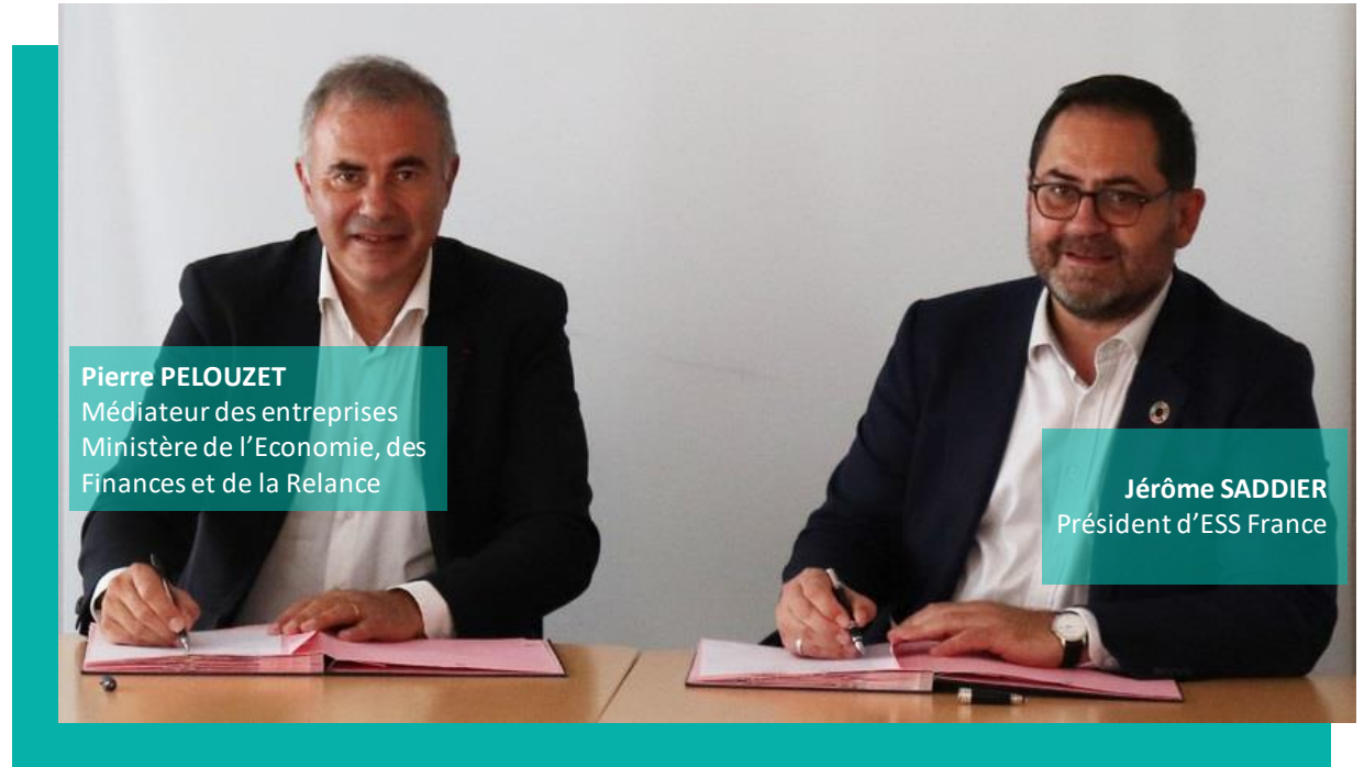
Pierre PELOUZET Médiateur des entreprises Ministère de l'Economie, des Finances et de la Relance